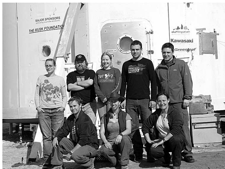
l'équipage de la mission d'entraînement MDRS 58 (TMS)

A noter que la Mars Society présentait trois communications au 38 ème Congrès de Science Lunaire et Planétaire, en mars dernier, dans le cadre du programme éducatif « Spaceward Bound » qu'elle conduit en collaboration avec la NASA.